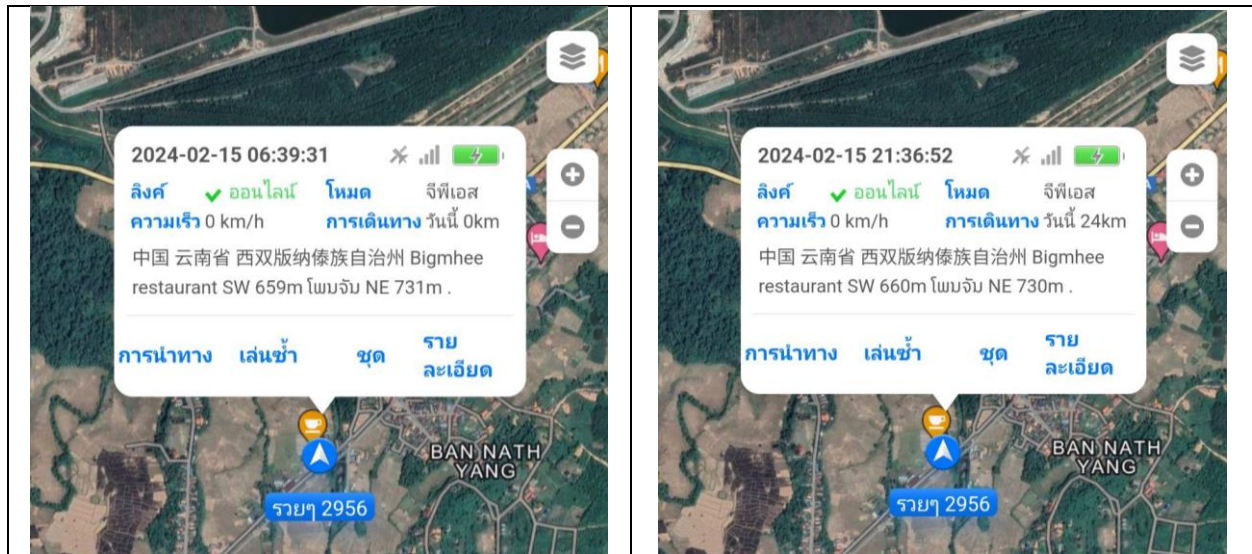
สรุปการใช้รถ 2956 24km