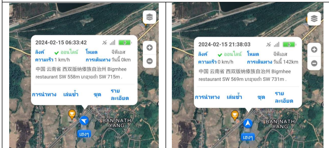
สรุปการใช้รถ 3145 142km